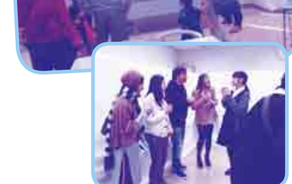
「海外に進出している企業の紹介」