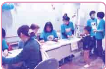
「デジカメ写真で楽しい思い出づくり」