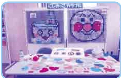
「子どもたちの作品紹介」