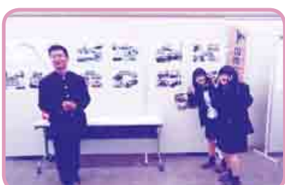
「西尾市姉妹都市親善訪問団(高校生)の紹介」