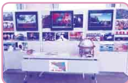
「ブラジルの写真展」