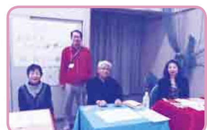
「中国旅行の写真展示と占いコーナー」