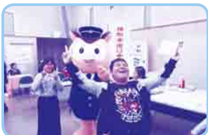
「西尾警察署からのお知らせ」