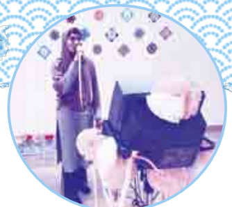
「からおけひろば カラオケ広場」

2017年3月5日(日)に「国際交流フェスタ2017」～世界のひとと心をつなごう～が西尾市総合福祉センターで開催されました。どのイベントも活気に溢れ、今年も非常に楽しい時間となりました。