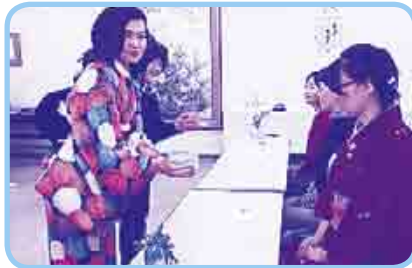
「お抹茶のおもてなし」