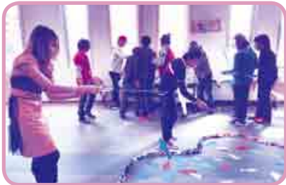
「Let's play together !」