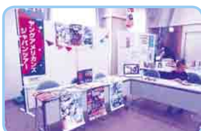
「ヤングアメリカンズ安城公演の紹介」