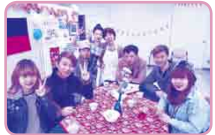
「世界のお茶飲みくらべ！」