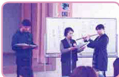
「世界の絵本の読み聞かせ」