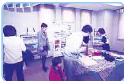
「異文化理解ニュージーランド」