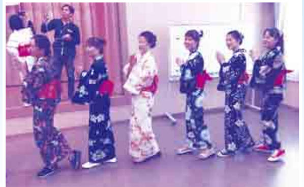
〈昨年の盆踊りの様子〉