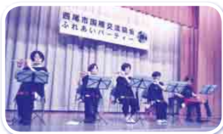
篠笛の会 十人十音色さん