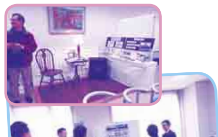
「海外に進出している企業の紹介」