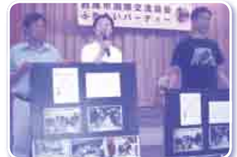
ネパール地震救援金募金の 呼びかけ

出し物は、西尾高等学校吹奏楽部のみなさんの華やかで軽快な演奏、フラメンコスタジオ アマネセールのみなさんの情熱的な歌と、床を踏み鳴らす独特のフラメンコダンスで会場は大盛り上がりでした。パーティーも和気あいあいとした雰囲気、様々な国の人達が食事をしながらお互い楽しそうに語り合う姿が印象的でした。