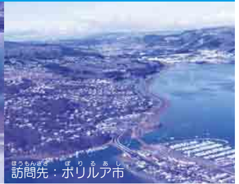
訪問先：ポリルア市