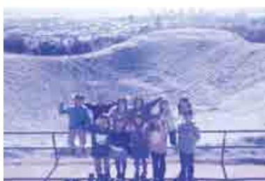
2013年度訪問団と一緒に(ニュージーランドにて)

また、言葉 ことば は文化 ぶんか だと言われます。言葉 ことば を学ぶことはその国の文化 ぶんか を理解することになるのです。