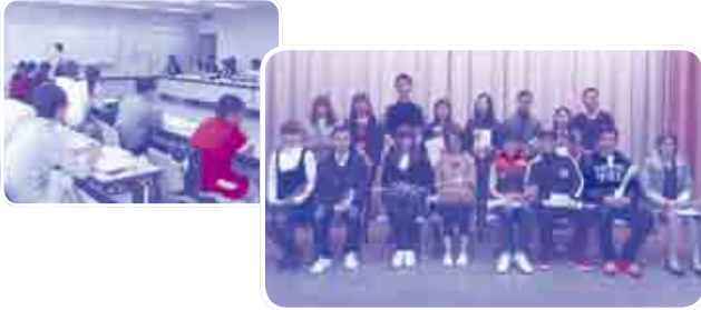
日本語スピーチ発表会

普段は福祉センターで授業形式や少人数形式で日本語の勉強をしています。また、授業以外にも「市内散策」、「餅つき体験」、「日本語スピーチ発表会」など、日本文化を学べるイベントも行っています。