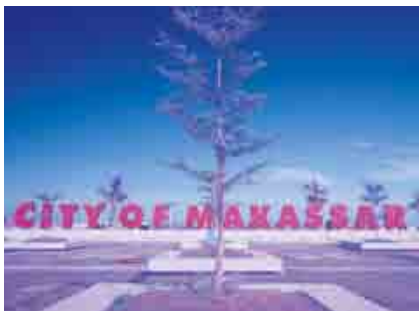
まかっさるのくうこう