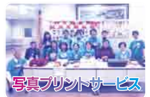
写真プリントサービス

毎年好評のデジカメ写真のプリントサービスです。当日撮っ た写真を一人1枚無料で差し 上げます。お友達やご家族との 楽しい思い出の記念にいかが ですか?