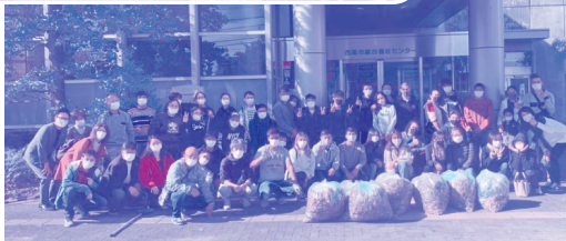
せいそうかつどう 清掃活動