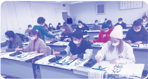
はじめてのしよどう

今年度から新しく作られた「多文化共生部」です。西尾の名所を紹介する動画の撮影や編集スキルを学ぶビデオ講座、初めてのしよどう体験など、イベントを中心に活動しています。1年目ということもあり、手探りの中、試行錯誤を繰り返してきました。どのような企画をすればもっと外国人に興味を持っていただけるのかを考え、イベントでは、『西尾にほんごひろば』の協力のもと、日本人と外国人が交流を深めることができたと思います。今後も日本人と外国人がコミュニケーションを取り、よりよい関係性を築いていける部会になるように活動していきます。